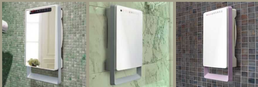
TOUCH VISIO front z lustrem